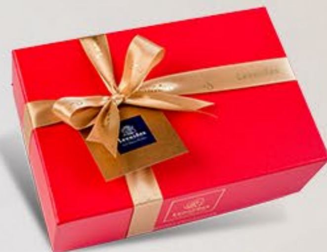
Bijoux & Love