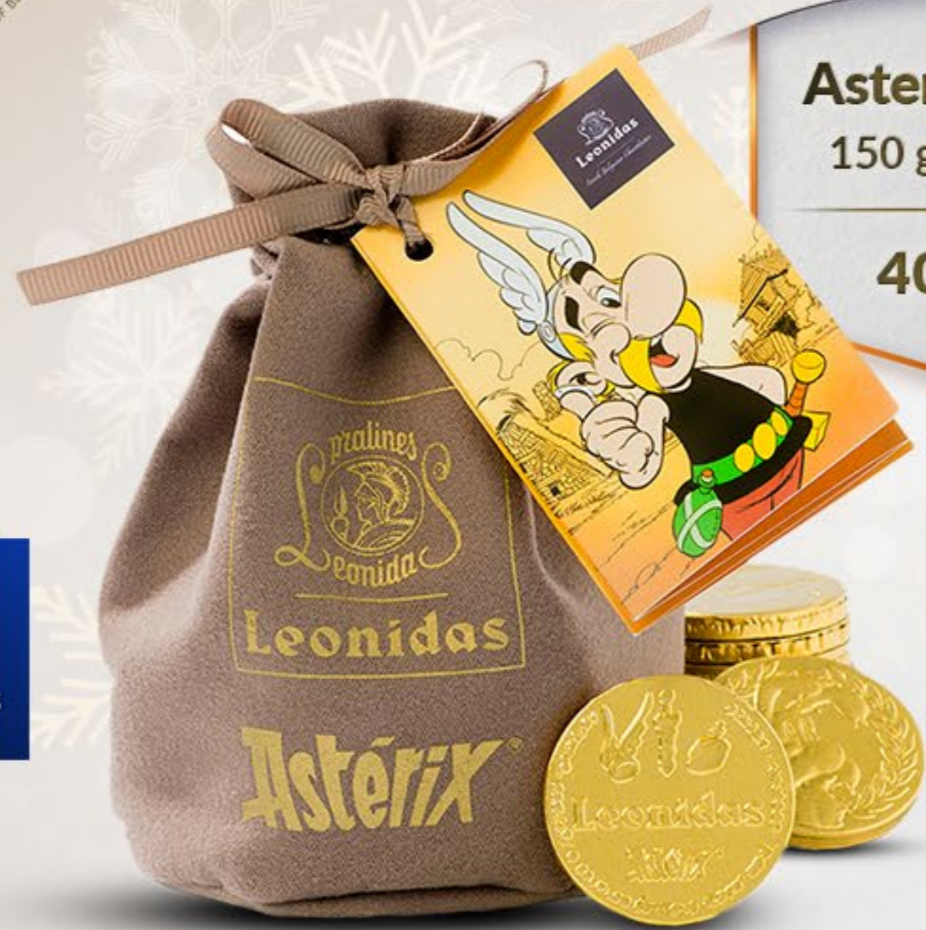
Asterix Bag 150 g bănuți 40 lei