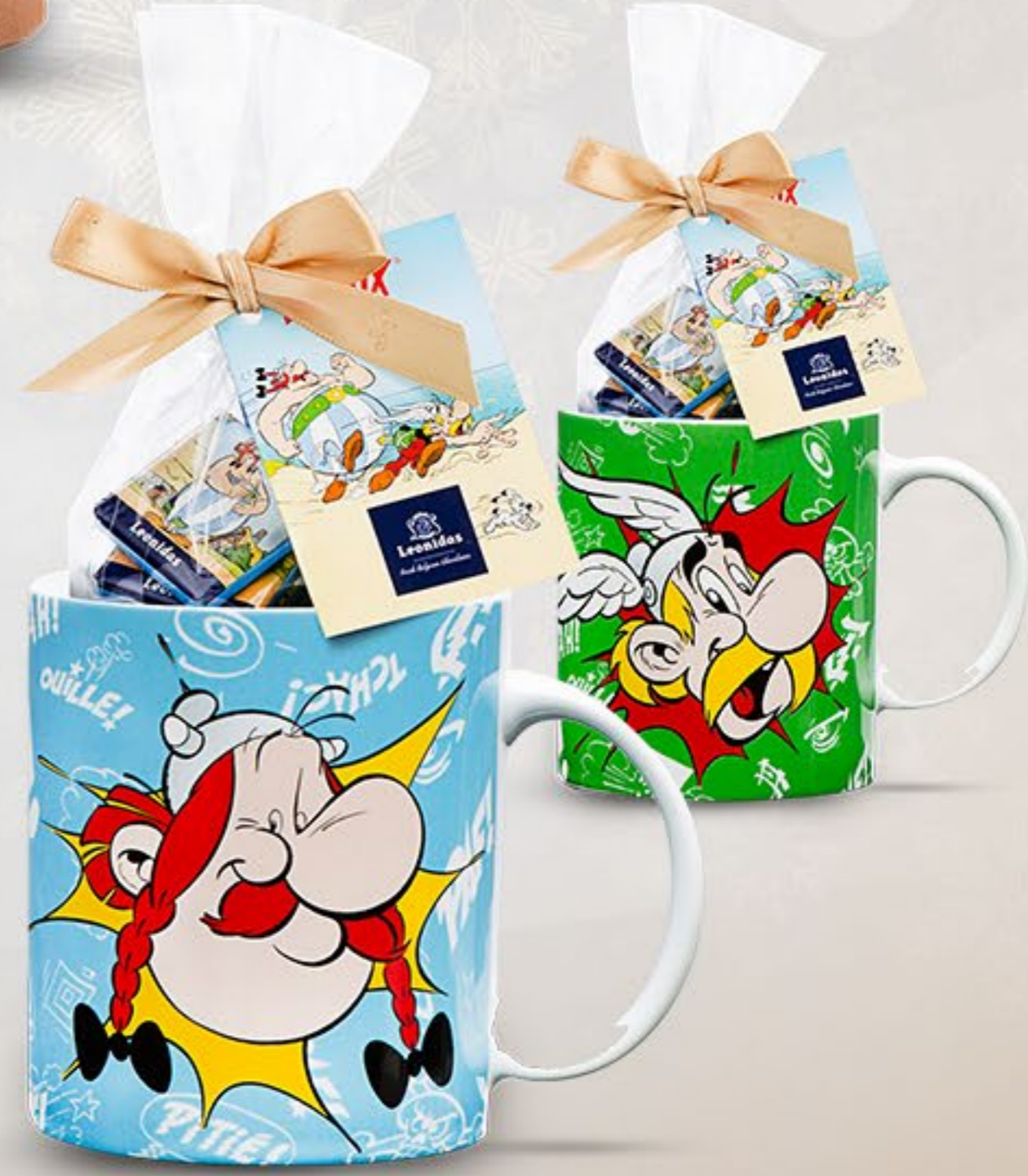
Asterix Cană 150 g mini tablete 60 lei