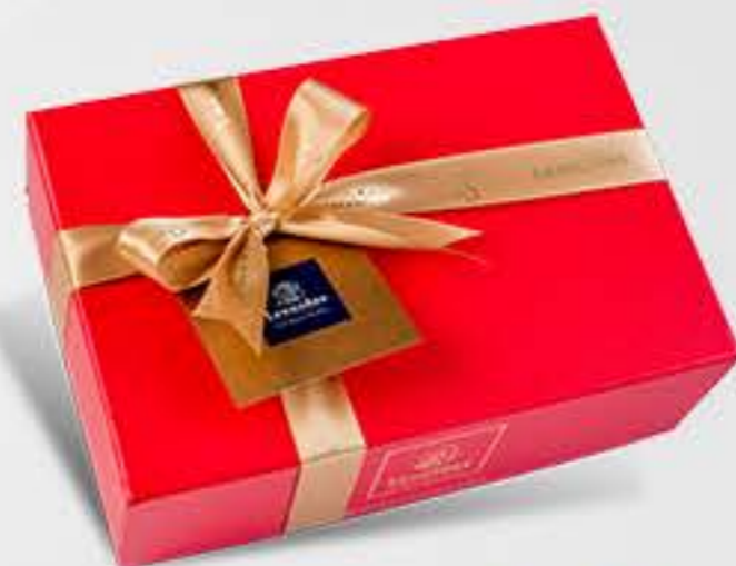
Bijoux & Love