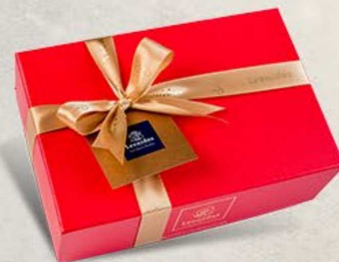
Bijoux & Love